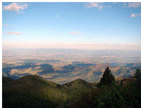
Pico do Itapeva