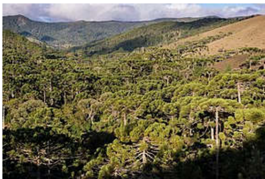
Parque Estadual de Campos do Jordão

(No Capivari está localizado o Sabor Chocolate, um dos parceiros do Evento. Lá serão oferecidos 20% de desconto nas compras para os Atletas e Familiares)