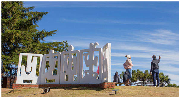
Museu Felícia Leirner