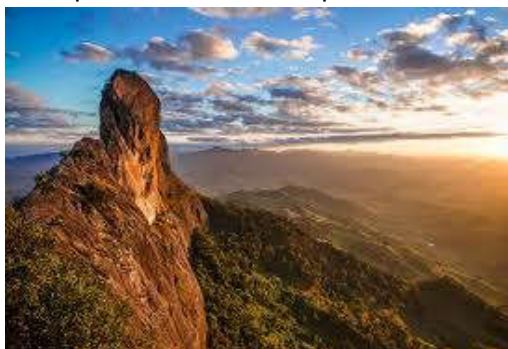
Pedra do Baú